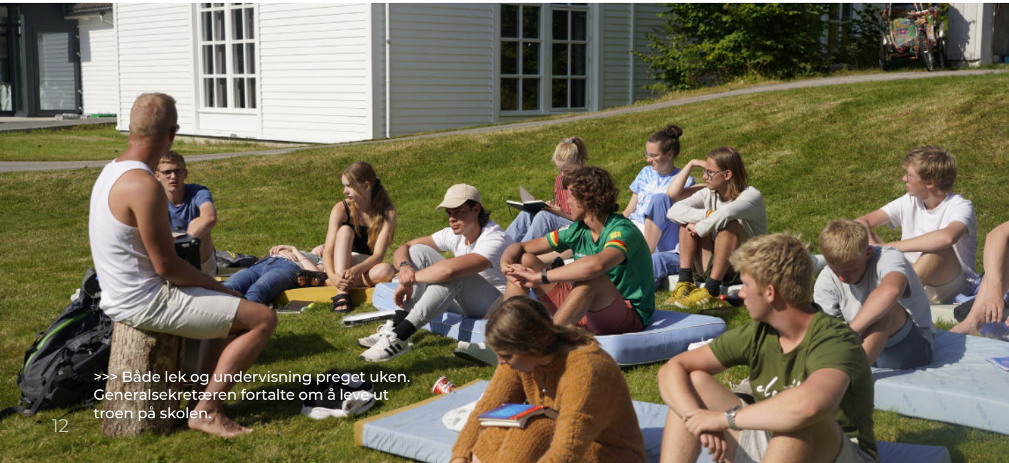
>>> Både lek og undervisning preget uken. Generalsekretæren fortalte om å leve ut troen på skolen.

Lagets Lederakademi ønsker å hjelpe ungdommer til å tørre å ta ledelse der de er, og lede med Jesus som Herre. Det er fantastisk gøy å se hvordan ungdommene allerede har fått et større perspektiv på hvordan de kan tjene sin neste og lede sin generasjon. Vi gleder oss til å se hva de kan utrette fremover – og til å ta imot enda et nytt kull neste høst. ■