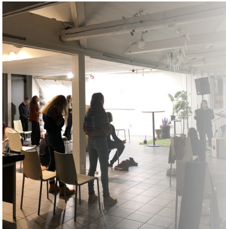
Frå Stallen i haust