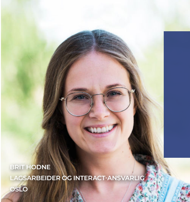
BRIT HODNE LAGSARBEIDER OG INTERACT-ANSVARLIG OSLO

vi ikke slutter å prøve, selv om vi ikke alltid klarer å ta de beste valgene. Det er bedre å gjøre noe enn å gjøre ingenting, tenker jeg! Alle monner drar. I Laget har vi laget en «lagslunsj» om klima og Bibelen, som jeg håper kan inspirere Lagsungdom over hele landet til å leve bevisst i forhold til skaperverket rundt oss. Det er jo tross alt en del av det å elske vår neste, og ta vare på alt det gode som Gud har skapt.