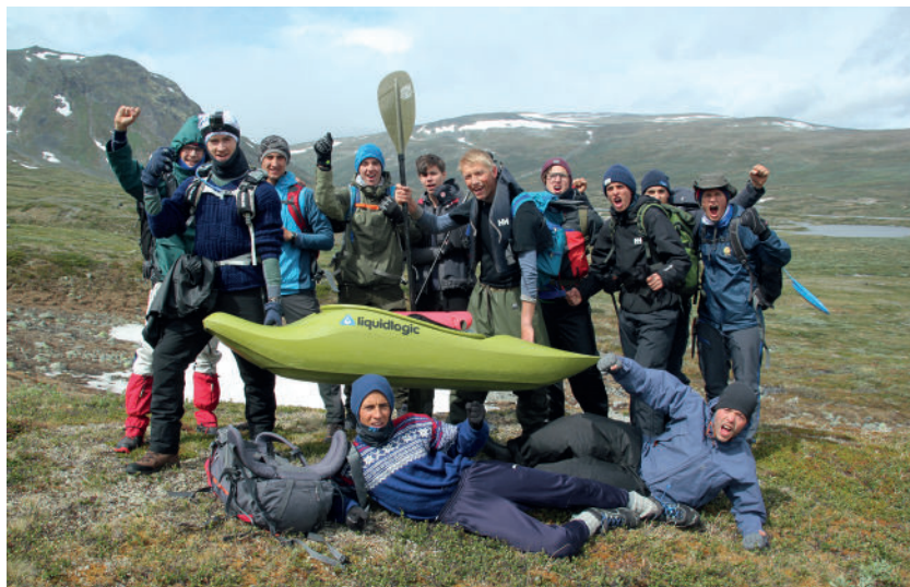
Over: Gjengen som var med på ”Mann 2018” i Jotunheimen.