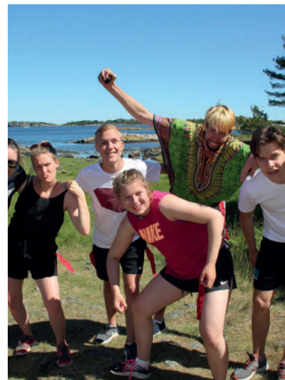
Teambuilding på LINK 2018