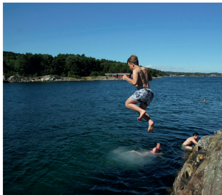
Bading ble det også tid til på generalforsamlingen i Grimstad.

Se flere bilder på vår facebookside facebook.com/lagetnkss