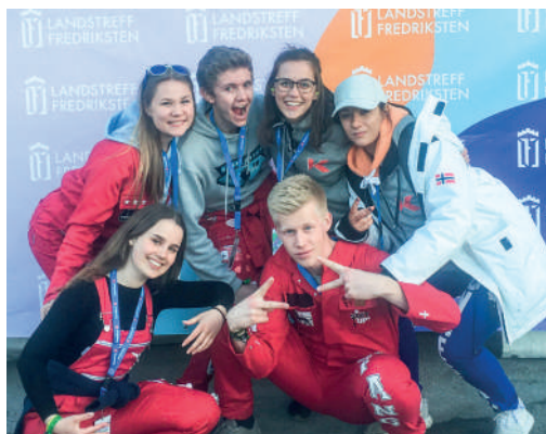
Krussen var tilstede på Landstreffet Fredriksten , Tryvann og Lillehammer.