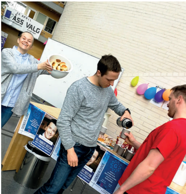
"Kaffi og boller" deles ut på NTNU Ålesund under Godhetsuka 2018.