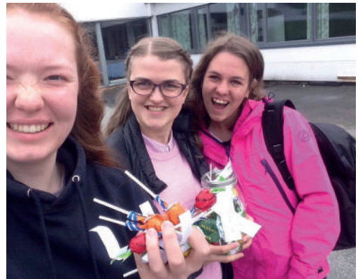
Også i Bergen er Godhetsuka 2018 en suksess.