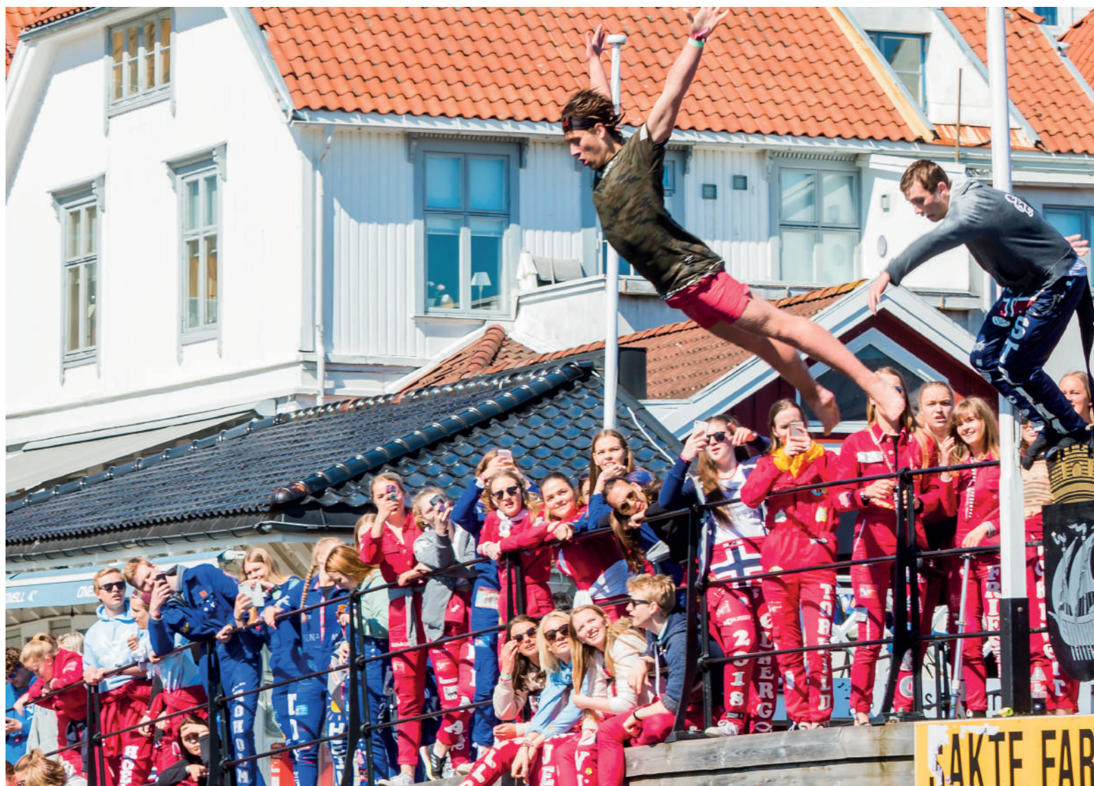
Krussen suser inn i russetiden på Russetreffet Kragerø .