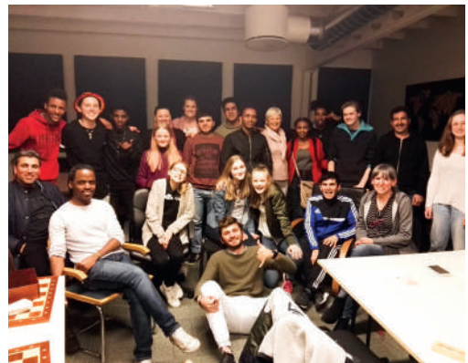
Nytt Interact-lag har startet opp i Hamar!