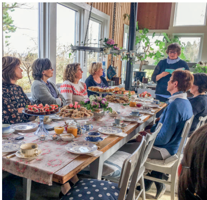
I Larvik disket engasjerte kvinner opp med hjemmelaget scones og syltetøy på et "Traditional English Tea Party" til inntekt for Laget.