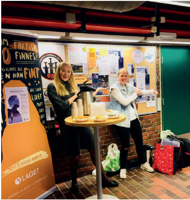
Velkommen inn på Skepsisuka Stavanger!