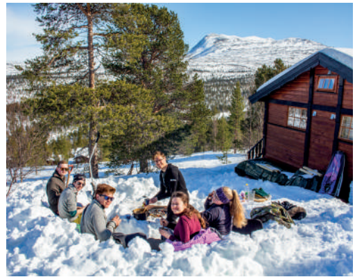
Bålkos på Disippelgruppe i Nord!