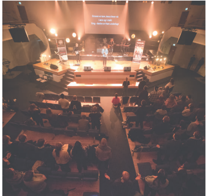
Lovsang på StudentFORUM 2018