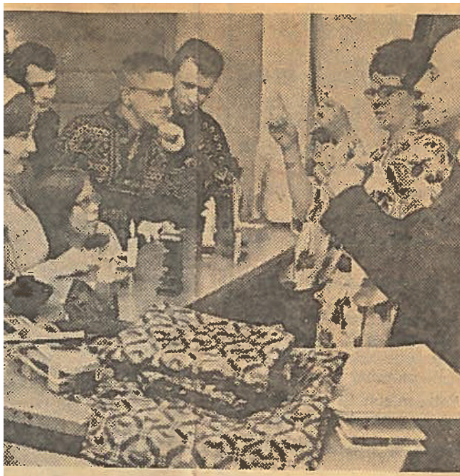
Laget for 50 år siden: "Livlig samtale" heter dette bildet fra det første skolelaget for døve . Bildet sto på trykk i Vårt Land 26. januar 1968, og er fra et lagsmøte i de døves skolelag i Oslo.