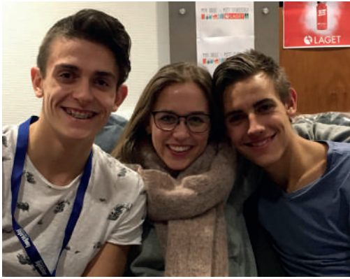
God stemning hos standteamet på Impuls Stavanger 2018