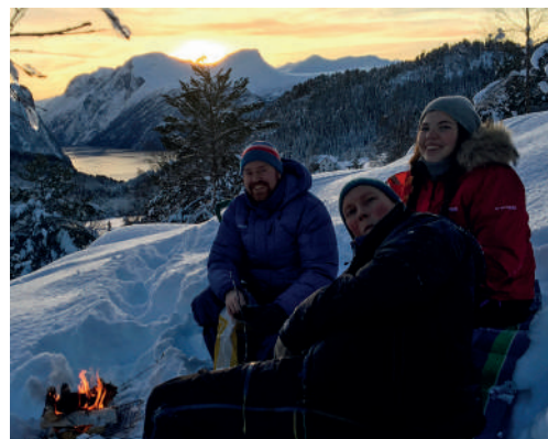
Nordvestteamet på juleavslutning i Liabygda.