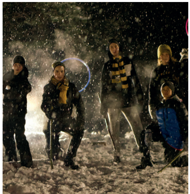
På NÅLK feiret de det nye året med rumpeldunkturnering.