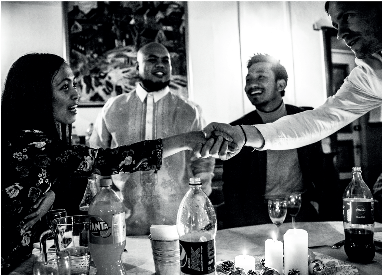
Nye bekjenskaper knyttes under julemiddagen arrangert av Laget Interact i Oslo.