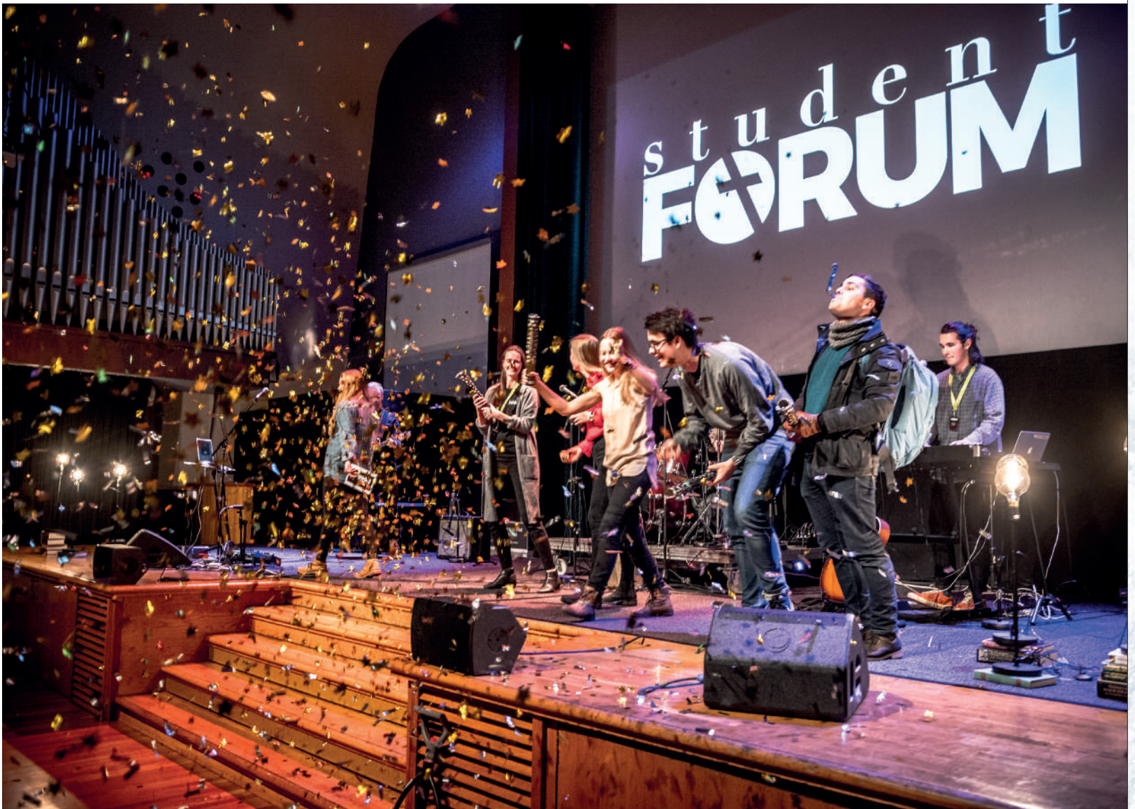
StudentFORUM 2018 smeller i gang i Storsalen!