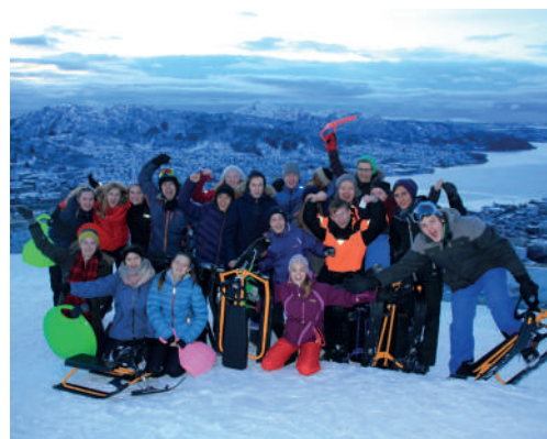
Akedag på reCharge i Region Vest.