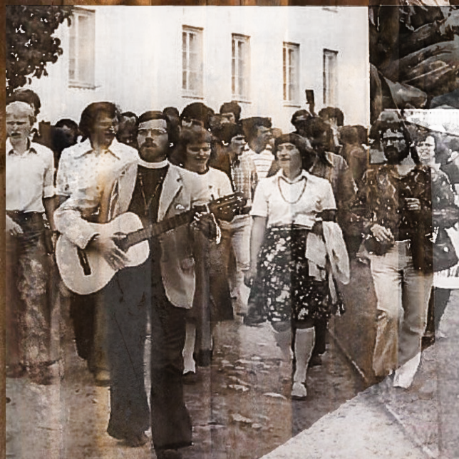
Lederskole for studenter, Fredtun, Stavern 1977