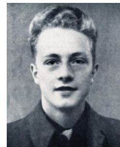
TOMAS PER TRÆGDE