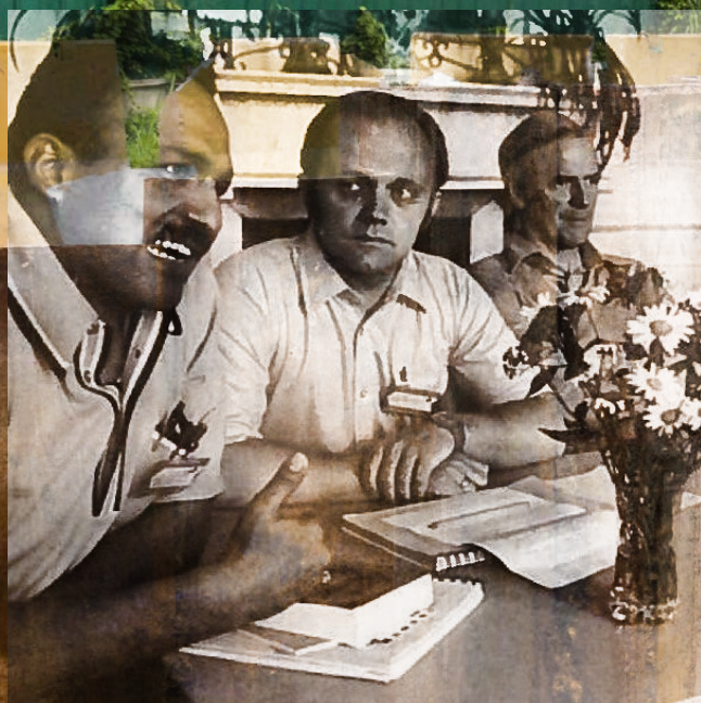
IFES – Internasjonal Fellowship of Evangelical Students World Assembly, Hurdal, 1979.

12. mars 1924 ble studentlaget stiftet på et møte på Menighetsfakultetet i Oslo. Men det første Lagsmøtet fant sted allerede fjorten år år tidligere.