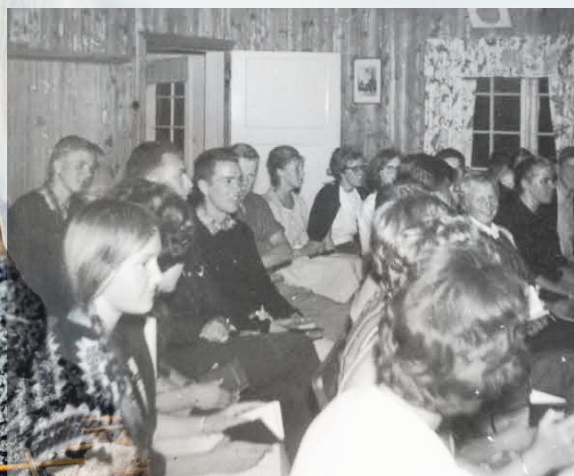
Hyggekveld i peisestua

Alt i alt ønsker vi å fortsette mye av den retningen som Laget allerede har. Vi er stolt av mye av det gode som skjer. I en verden som i økende grad er fremmed for Jesus, må vår avhengighet som organisasjon hvile helt og fullt på Ham. Det er vårt viktigste fundament for 100 nye år.