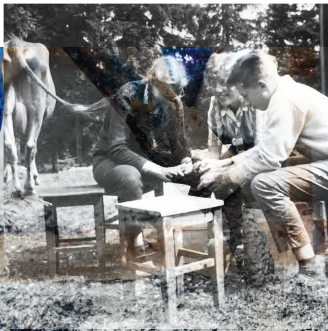
Potetskreiling med et landlig innslag i bakgrunnen

Etter en intern kartlegging foretatt like før jul, ser vi at Laget fortsatt er sterk på ledertrening. Vi skårer særlig høyt på det relasjonelle, men ser samtidig at vi har en stor jobb foran oss når det gjelder organisatorisk lederskap. Vi trenger å gjenreise systematikken rundt ledertrening som Laget historisk sett har vært så kjent for. Gjennom 20-tallet håper vi å se en ny generasjon ledere reise seg i Laget, som tar sikte på å tjene hele organisasjons-, kirke- og samfunnslivet. Dette jobber vi med å utforme, men for å lykkes er vi helt avhengig av kontakten mellom generasjonene. Vi trenger at voksenledere og mentorer atter kommer lagsungdommer til unnsetning og vil gå et stykke vei med dem. Utfordringen er herved sendt.