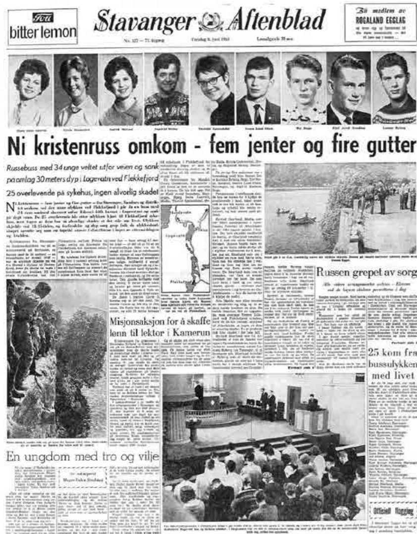
Stavanger Aftenblad, 6. juni 1963

Men til den dag i dag så utpeker 5. juni 1963 seg som en mørk dag i Kristenrussens historie. Den dagen kjørte en russebuss med til sammen 34 russ av veien og havnet i Logavannet, rett ved Flekkefjord. Hele ni kristenruss omkom, mens de var på vei fra Stavanger til Flekkefjord for å samle inn penger til et misjonsprosjekt i Kamerun.